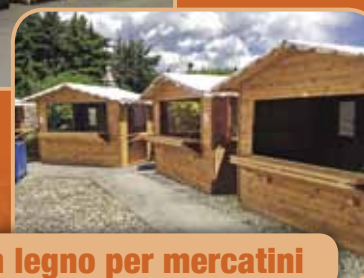
Casette in legno per mercatini